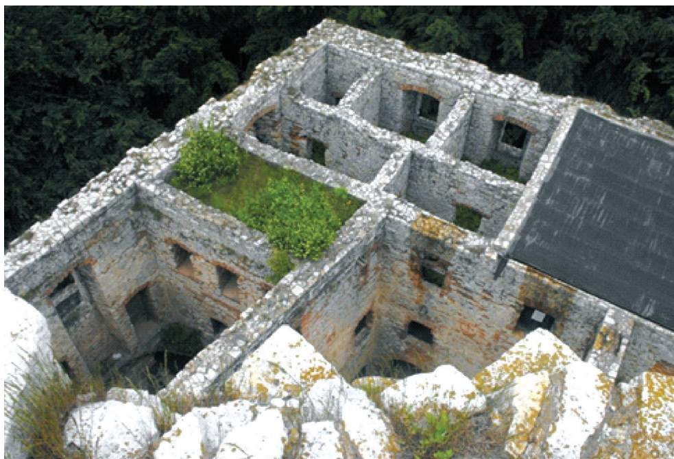
III. 1. Lipowiec Castle, view from the terrace of the tower towards the west

II. 1. Zamek Lipowiec, widok z tarasu wieży w kierunku zachodnim