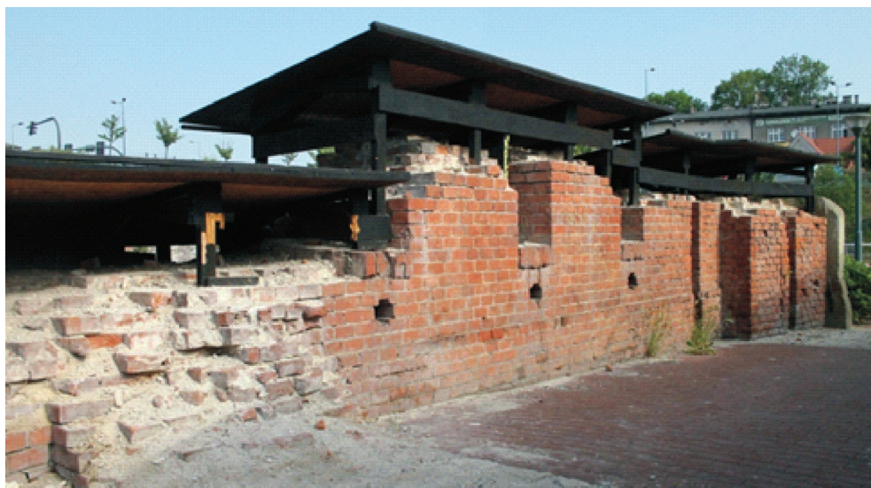
III. 2. Cracow, Rondo Mogiłskie, relics of the bastion V "Lubicz". Provisional protections of the crumbling and devastated crowns of the walls

II. 1. Zamek Lipowiec, widok z tarasu wieży w kierunku zachodnim