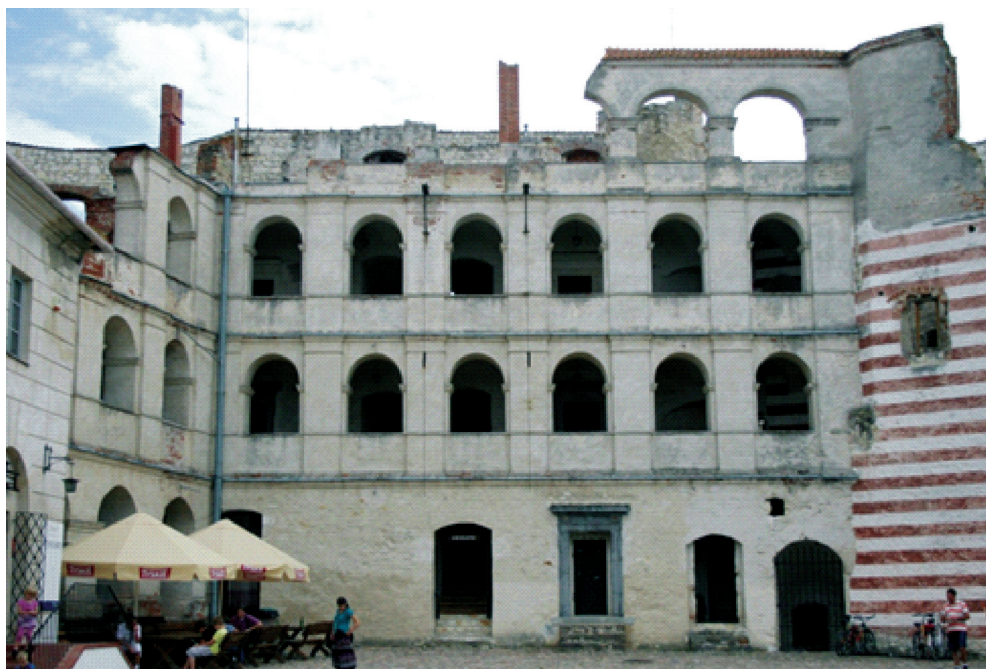
III. 4. Castle in Janowiec, eastern arcades