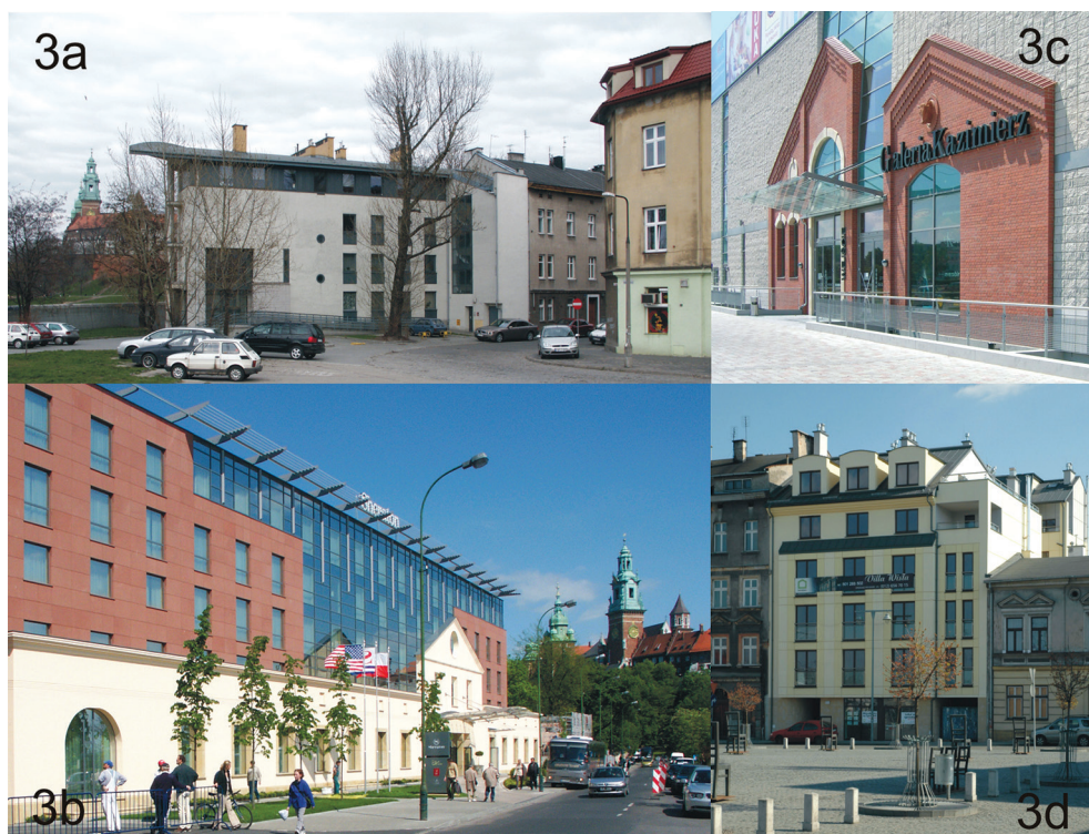
III. 3. Solidification of the former urban form with the use of design solutions in new buildings. Residential building with a service section at ul. Zamkowa 2 (III. 3a). Sheraton Hotel at ul. Powiśle 7 (III. 3b). Eastern façade of the Kazimierz Trade Centre (III. 3c). Residential building with a service section at Ghetto Heroes' Square 17 (III. 3d)

II. 3. Utrwalanie dawnej formy urbanistycznej za pomocą rozwiązań projektowych w nowych budynkach. Budynek mieszkalny z usługami przy ul. Zamkowej 2 (II. 3a). Hotel Sheraton przy ul. Powiśle 7 (II. 3b). Elewacja wschodnia Galerii Kazimierz (II. 3c). Budynek mieszkalny z usługami przy pl. Bohaterów Getta 17 (II. 3d)