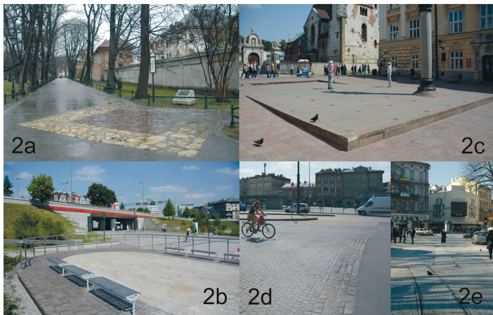
III. 2. Surface design solutions. Fragment of Planty: course of the former city walls and the location of Saddlers' Donjon (III. 2a). Interior of Mogilskie Roundabout – fragment of the projection of the “cat's ears” caponier (III. 2b). Square of St. Mary Magdalene – outline of the former Church of Mary Magdalene (III. 2c). The Ghetto Heroes' Square – area of the ghetto during WWII (on the left) and the location of the wall (III. 2d). Szewska Street – displayed tram tracks (III. 2e)

II. 2. Rozwiązania nawierzchni. Fragment Plant – przebieg części dawnych murów miejskich i lokalizacja Baszty Rymarzy (II. 2a). Wnętrze Ronda Mogilskiego – fragment rzutu kaponier „kocie uszy” (II. 2b). Plac św. Marii Magdaleny – zarys dawnego kościoła św. Marii Magdaleny (II. 2c). Plac Bohaterów Getta – teren Getta w czasie II wojny światowej (po lewej) i przebieg jego muru (II. 2d). Ulica Szewska – odsłonięte szyny tramwajowe (II. 2e)