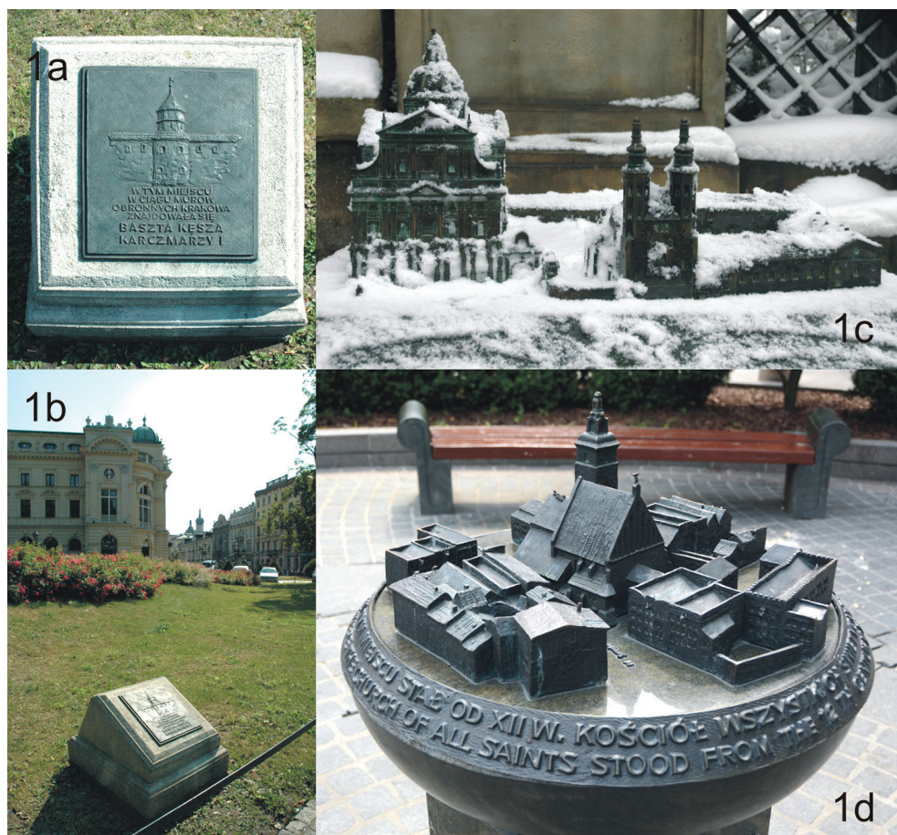
III. 1. Visual and tactile information. Planty – one of the boards showing the location and the appearance of non-existing elements of Kraków defence structures (III. 1a and 1b). Grodzka Street – model of existing Churches of St. Peter and St. Paul and St. Andrew (III. 1c). All Saints' Square – model of the non-existing Church of All Saints and its former vicinity (III. 1d)

II. 1. Informacja wizualna i dotykowa. Planty – jedna z tablic ukazujących lokalizację i wygląd nieistniejących elementów obwarowań Krakowa (II. 1a i 1b). Ulica Grodzka – makieta istniejących kościołów św. św. Piotra i Pawła oraz św. Andrzeja (II. 1c). Plac Wszystkich Świętych – makieta nieistniejącego kościoła Wszystkich Świętych i jego dawnego otoczenia (II. 1d)