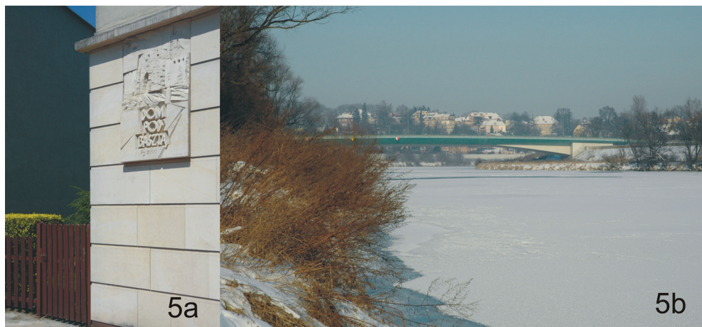
III. 5. New facilities with names making references to the urban past of the venue. House Under the Donjon at ul. Skawińska (III. 5a). Zwierzyniec Bridge (III. 5b)

II. 4. Zewnętrzne elementy rezerwatów archeologiczno-architektonicznych w przestrzeni Rynku Głównego. Podziemia kościoła św. Wojciecha – oddział Muzeum Archeologicznego (II. 4a). Podziemia Rynku – oddział Muzeum Historycznego Krakowa (II. 4b)