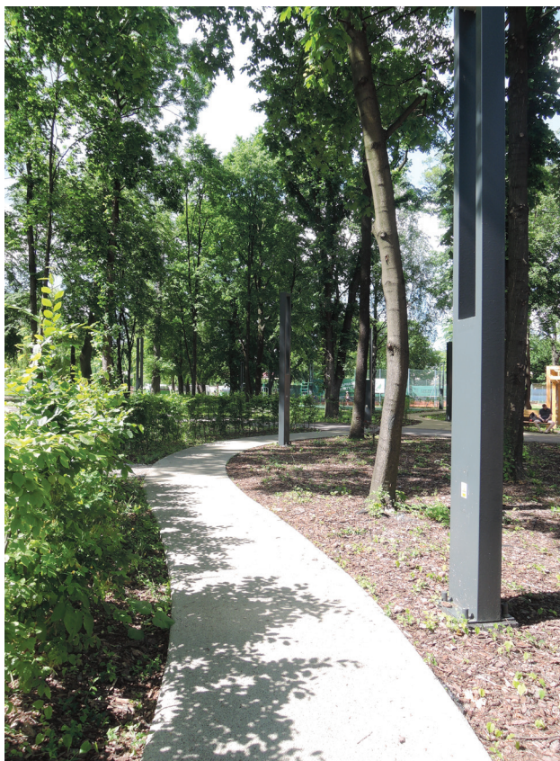
III. 3. The part of Łobzów garden