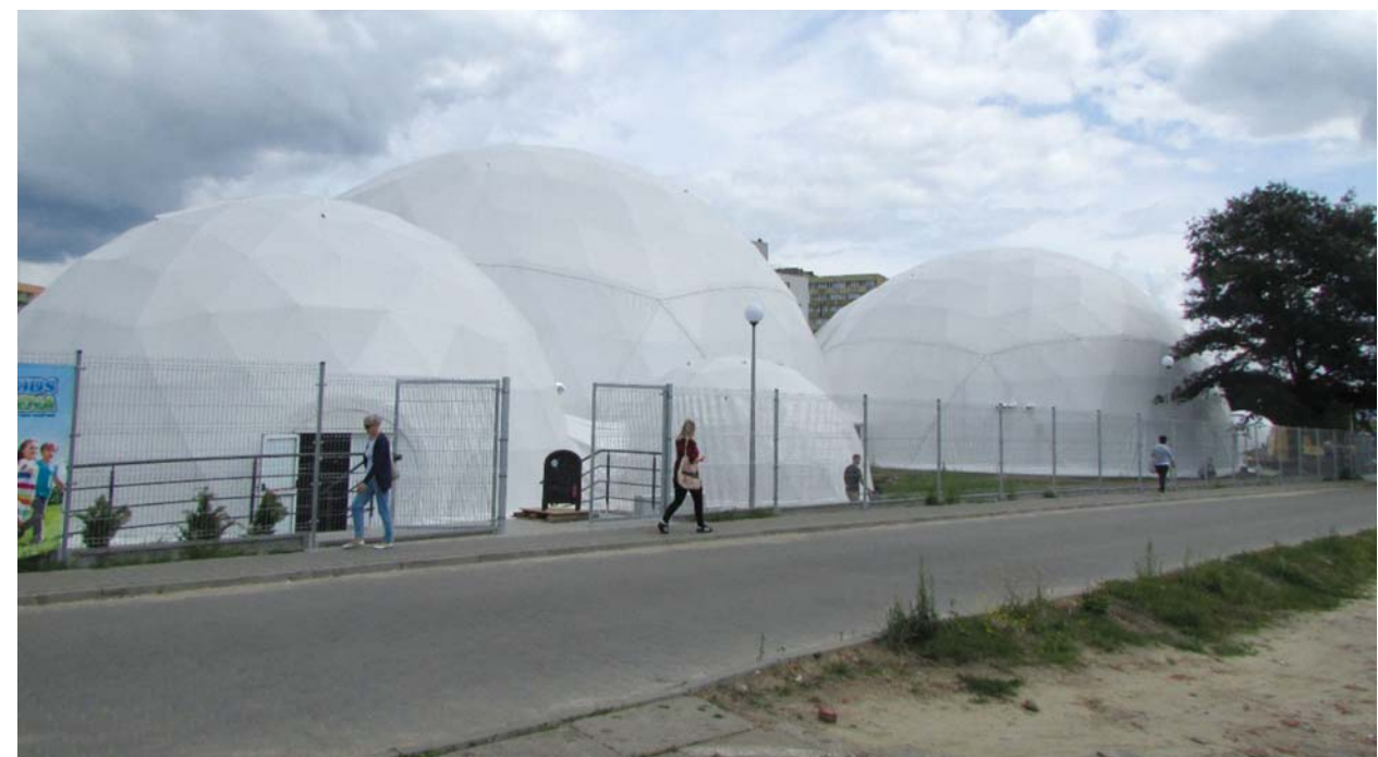
Il. 3. Park rozrywki dla dzieci z wykorzystaniem jednopowłokowych struktur przestrzennych firmy Freedomes (w trakcie realizacji, stan – lipiec 2017 r.) przy ulicy Ofiar Oświęcimia w Szczecinie. Amusement park for children that uses the single-shelled spatial structures by Freedomes (in realisation, july 2017) at the Ofiar Oświęcimia Street in Szczecin.

The illuminations of an architecture became, since few decades, the element that raises the aesthetic value of single objects, and referring mostly to the historical architecture, they allow to create kind of performances and stories painted with light. A little different rules were followed by the illumination’s creators in new buildings, in which the light systems were the core of the architectural concept. The examples of this kind of solution may be the illuminations that react to the context of the surroundings. The classic is the Tower Of Winds (1988) by Japanese architect Toyo Ito, located in Yokohama. This mechanism, covered by perforated aluminium steel panels, becomes the multimedia sculpture in night. Through the wind and noise sensors, which are then processed by the comput-