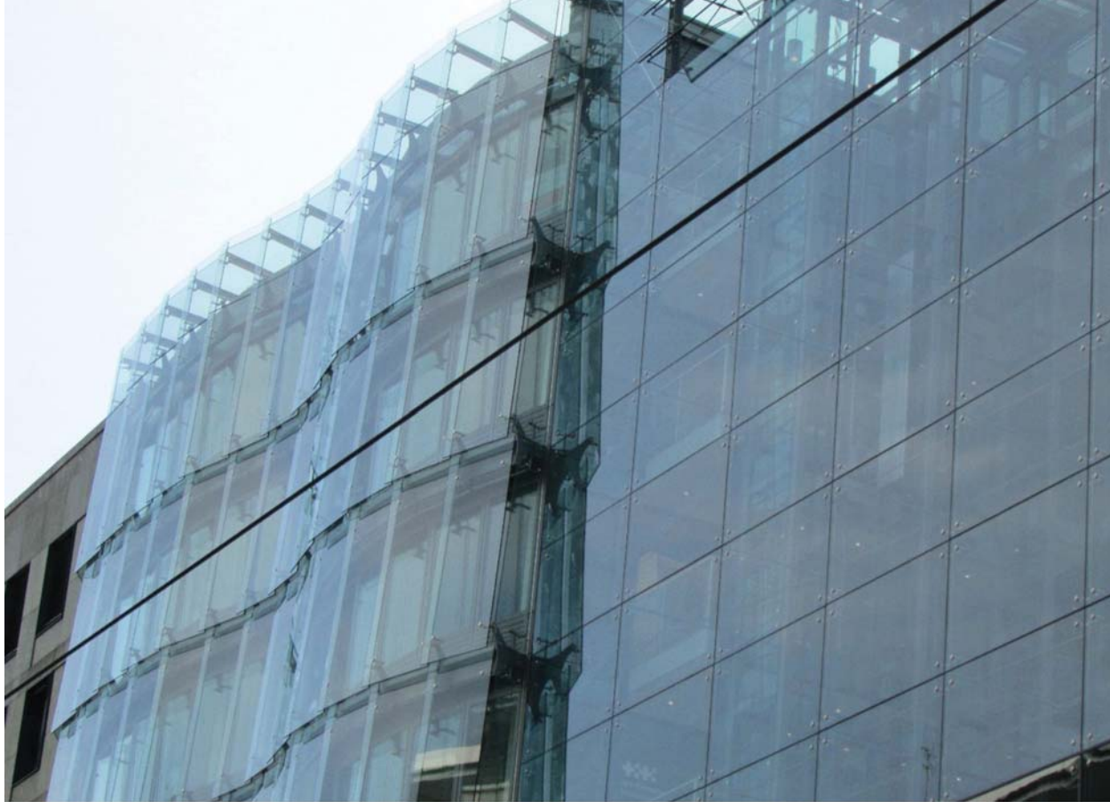
Il. 1. Detale elewacji Berliner Sparkasse-Beratungcenter przy Friedrichstraße 148 W Berlinie. Widoczne połączenie fasady kurtynowej bez ram konstrukcyjnych i ściany dwupowłokowej (szklenia uchylone, działające jako izolatory przejmujące nagrzane promienie słoneczne). / Berliner Sparkasse-Beratungcenter ’ elevation detail at the Friedrichstraße 148 Street in Berlin. The visible connection of a curtain wall without the construction frames and two-layered wall (opened glazings, working as insulators that receive the heat from sunlight).

wentylowanego izolatora (il. 1). Dla poprawy efektywności systemy dwupowłokowe wyposaża się dodatkowo w kurtynowe zasłony i zacienniacze, oraz zróżnicowane pod względem grubości, oraz stopnia przezroczystości szkło 5 . Wart odnotowania jest fakt, że stosowanie powyższych systemów dotyczy zarówno nowych budynków, jak i stosowane jest w pracach rewitalizacyjnych. Rozwiązania takie w istotny sposób wpływają na wyraz estetyczny architektury. Pierwsze ściany dwupowłokowe zastosowano już w początkach XX w., ale są one wciąż twórczo modyfikowane. Poza typowymi rozwiązaniami płaszczyzn szklanych, pojawiają się także projekty, które proponują wręcz pionierskie formy. Przykładem nowatorskiej architektury może być rozbudowa kampusu uniwersyteckiego 41 Cooper Square (2006–2009) w Nowym Jorku, która zaprojektowana została przez amerykańską pracownię Morphosis. Architekci zaproponowali stworzenie „perforowanej skóry ze stali nierdzewnej”, która odsunięta jest od szklanej elewacji. W budynku wprowadzono m.in. magazynowanie wody deszczowej, panele grzewcze i chłodzące, zielony dach i doświetlone atria, które pozwoliły na zmniejszenie zapotrzebowania na światło naturalne i sztuczne. Najważniejszym osiągnięciem architektów wydaje się jednak stworzenie formy architektonicznej, która nie kopiuje znanych już rozwiązań, ale wyznacza nowe horyzonty formalne i funkcjonalne.