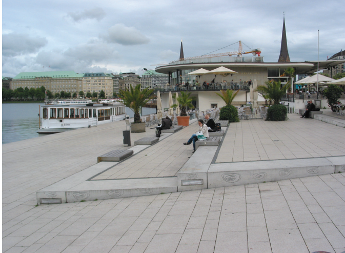
il. 13. Jungfernstieg, Hamburg / Jungfernstieg, Hamburg

się w falującą płaszczyznę z równomiernie rozmieszczonymi punktami świetlnymi. Kompozycję tę można określić jako regularną o niezwykle wyrazie plastycznym.