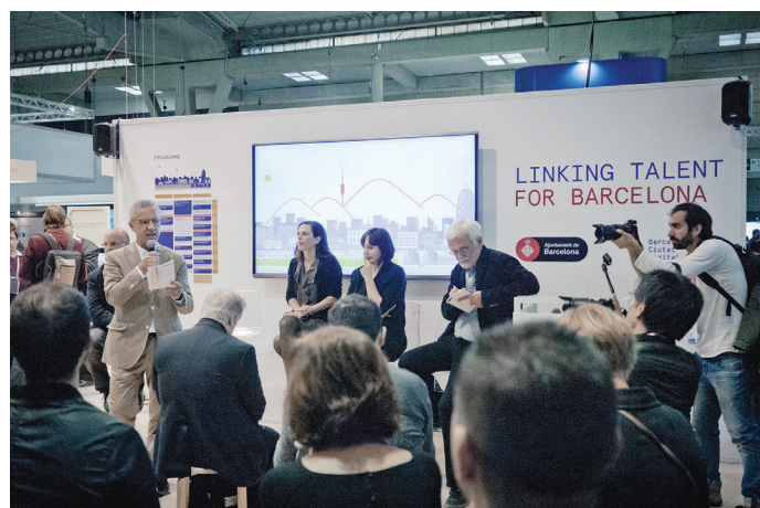
Il. 1–6. Smart City Expo, fot. Piotr Celewicz/Smart City Expo, phot. by Piotr Celewicz