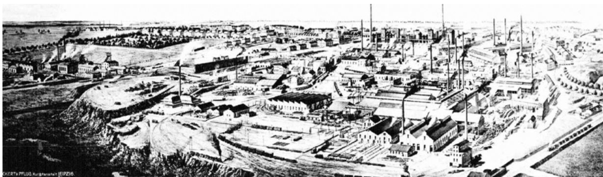
Ryc. 1. Friedenshütte – panorama z 1906 r. Rycina [w:] http://www.wirtualnaruda.pl/BK/1295-BK.pdf

Fig.1. Friedenshutte — panorama from 1906. Sketch [in:] http://www.wirtualnaruda.pl/BK/1295-BK.pdf