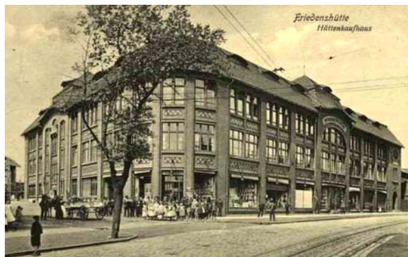
Ryc. 3 Kaufhaus w 1. połowie XX wieku na archiwalnej pocztówce. Pocztówka [w:] archiwum autora

swojego wizerunku dyrekcja huty podjęła szereg kolejnych inwestycji społecznych, z jednej strony wspierających ludność, z drugiej zwiększających efektywność pracy. W 1873 wybudowała nową szkołę i dwa lata później utworzyła instytucję opieki nad sierotami. W 1877 „nowa szkoła” otrzymała status szkoły powszechnej. Liczba pracowników Friedenshütte stale rosła i przekroczyła liczbę mieszkańców Schwarzwald. Brak wykwalifikowanej kadry stał się głównym problemem rozwijającego się zakładu, zwłaszcza że w 1884 huta uruchomiła pierwszą stalownię tomasowską i utworzyła nowoczesną koksownię, korzystającą z systemu Hoffmanna. Konieczny stał się dalszy rozwój osiedla Gute Hoffnung, dlatego jeszcze w tym samym roku powstał centralny wodociąg. Już rok później ukończono budowę kolejnych 26 domów