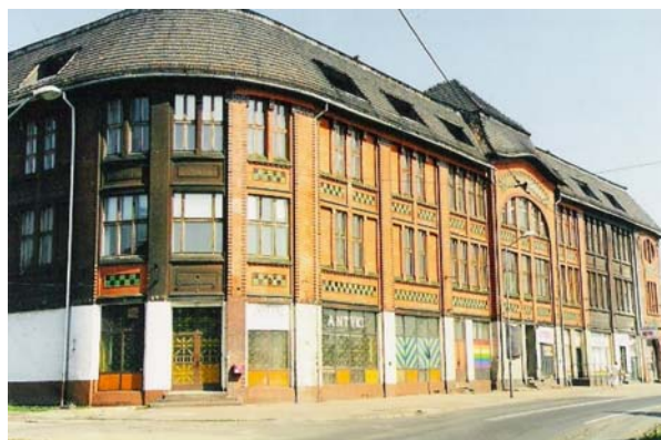
Ryc. 4. Kaufhaus przed rewaloryzacją. Fig. 4 a, b Kaufhaus before revalorisation.

floor space over 6000m 2 , which included an abattoir, a cold store, a granary, a hairdresser's and 3 restaurants. Located in the Gute Hoffnug 24 district, integrated with the housing along present-day Niedurnego St., it dominated the space both with its cubic capacity and height. Lavishly decorated with Art Nouveau motifs it constituted an avant-garde among simple brick 'familoks' (family houses) 25 .