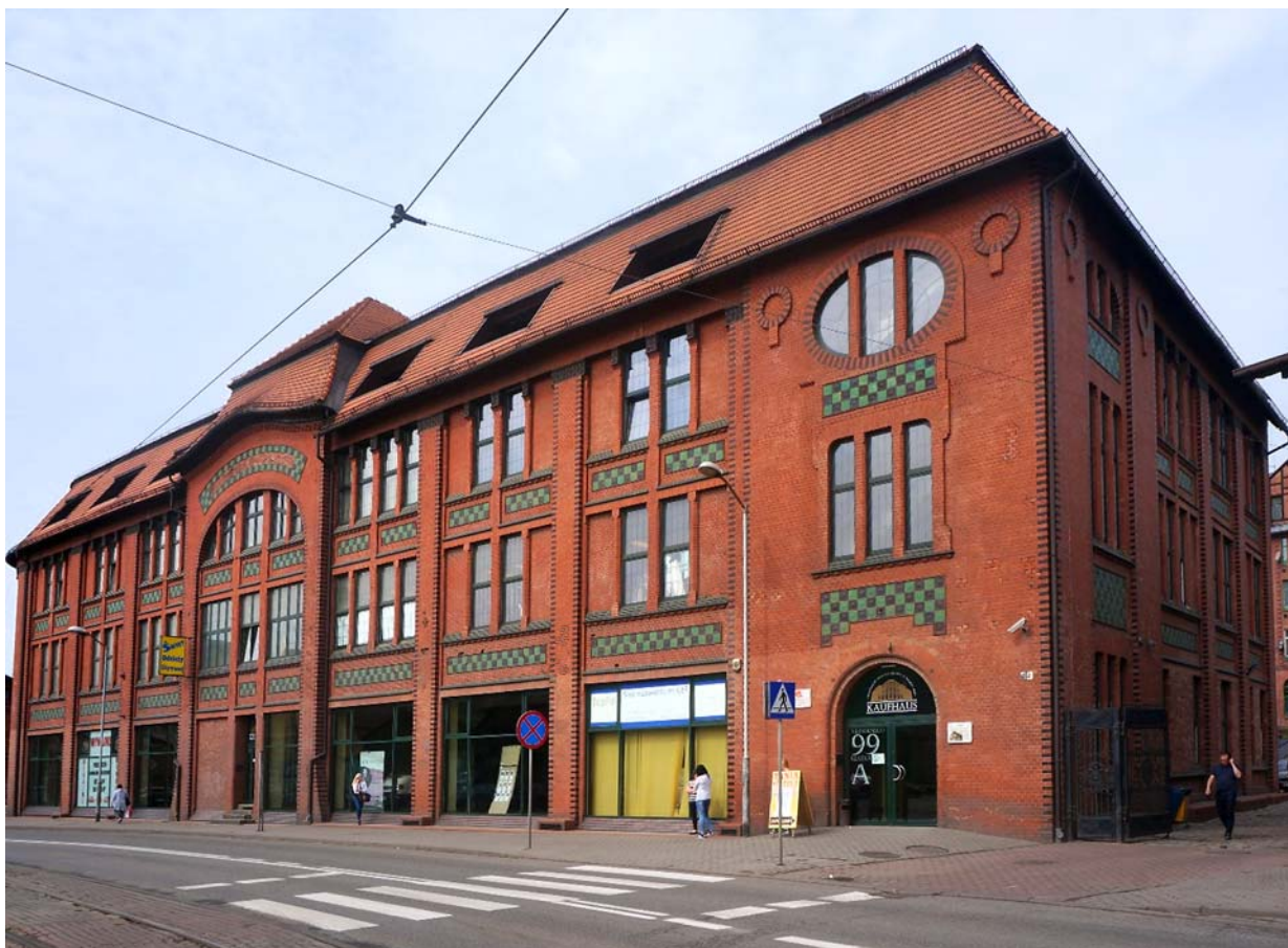
Ryc. 5 Kaufhaus po rewaloryzacji. Fot. [w:] archiwum autora, kwiecień 2018

Fig.5 Kaufhaus after revalorisation. Photo: [in:] author's archive, April 2018