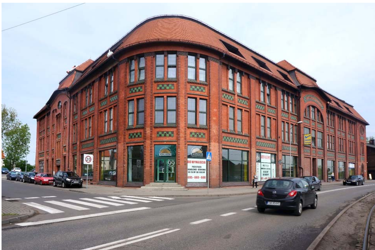
Ryc. 6 Kaufhaus po rewaloryzacji. Fot. [w:] archiwum autora, kwiecień 2018

Fig.5 Kaufhaus after revalorisation. Photo: [in:] author's archive, April 2018