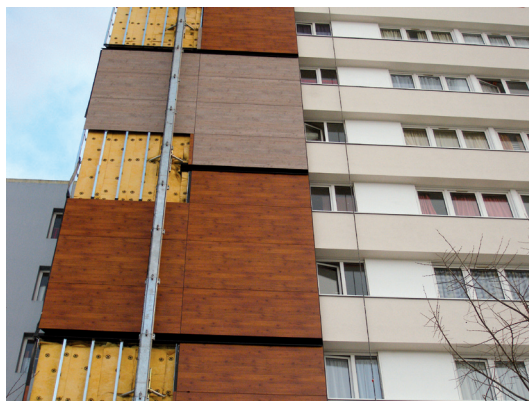
II. 2. Różnorodność struktur okładzinowych

III. 1. Arrangement of the layers of the elevation cover