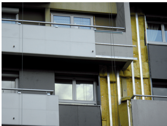
II.1. Układ warstw osłony elewacji

III. 1. Arrangement of the layers of the elevation cover