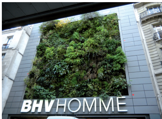
Il. 6. Elewacja bioaktywna – pionowy ogród

Ill. 5. Adjustable wooden internal panels