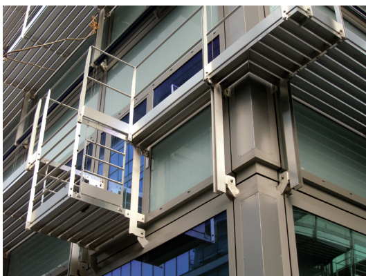
II. 4. Konstrukcja do obsługi rolet zewnętrznych

III. 3. Movable external and internal panels