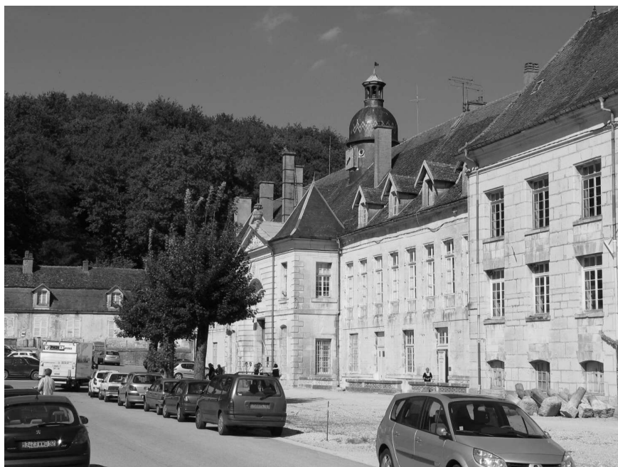
Rys. 2. Adaptowany na potrzeby więzienia w Clairvaux dawny budynek bramny opactwa; tędy prowadziło główne wejście na dziedziniec przed kościołem

podwórku i męski dom dla gości zostały przebudowane. Ogromny klasztor Clairvaux III – obejmujący refektarz, miejsca mieszkalne i bibliotekę – majestatyczny i surowy, dowodzi, że w XVIII w. opactwo było jednym z podtrzymujących surową regułę.