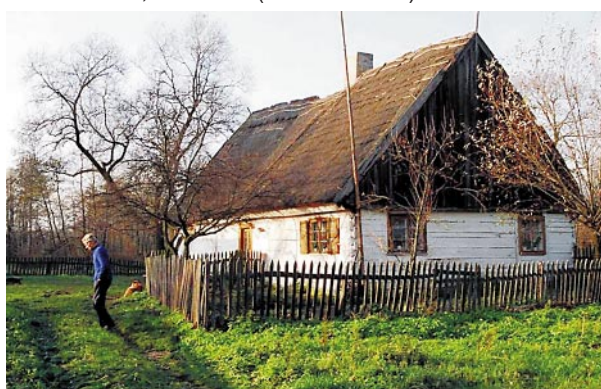
Leonów 8, gm. Słubice, woj. mazowieckie – dom z 13.X.1856 r. (data budowy wraz z jego historią wycięta na nadprożu drzwi wejściowych)