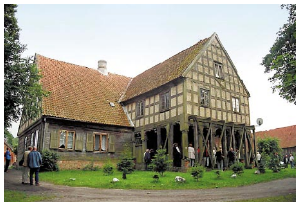
Żuławski dom podcieniowy charakterystyczny dla pierwszego okresu kolonizacji