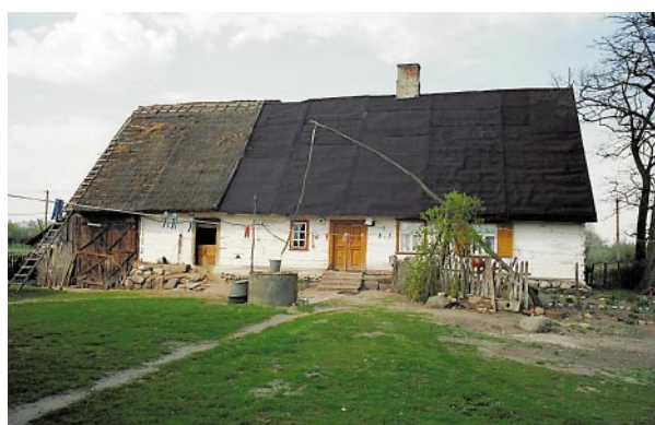
Dom ze wsi Życk Polski 61, gm. Słubice – w chwili obecnej stan zachowania tego pięknego obiektu jest tragiczny – niestety został przeznaczony on do rozbioru