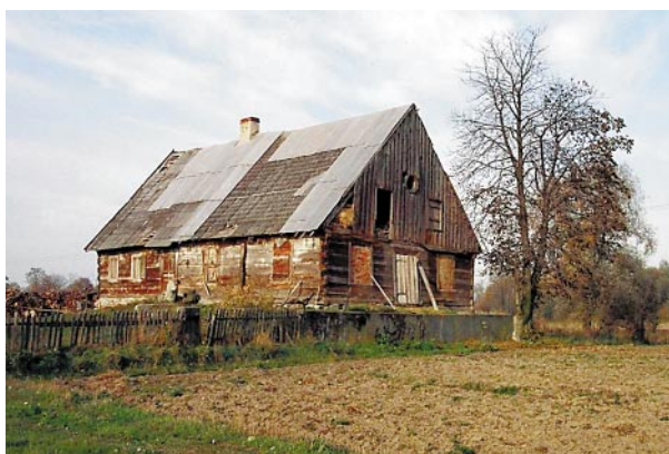
Najstarszy datowany budynek holenderski na Mazowszu z 1806 r. – zbór mennonicki w Sadach, gm. Słubice, woj. mazowieckie, z 1806 r. (stan z 2000 r.)