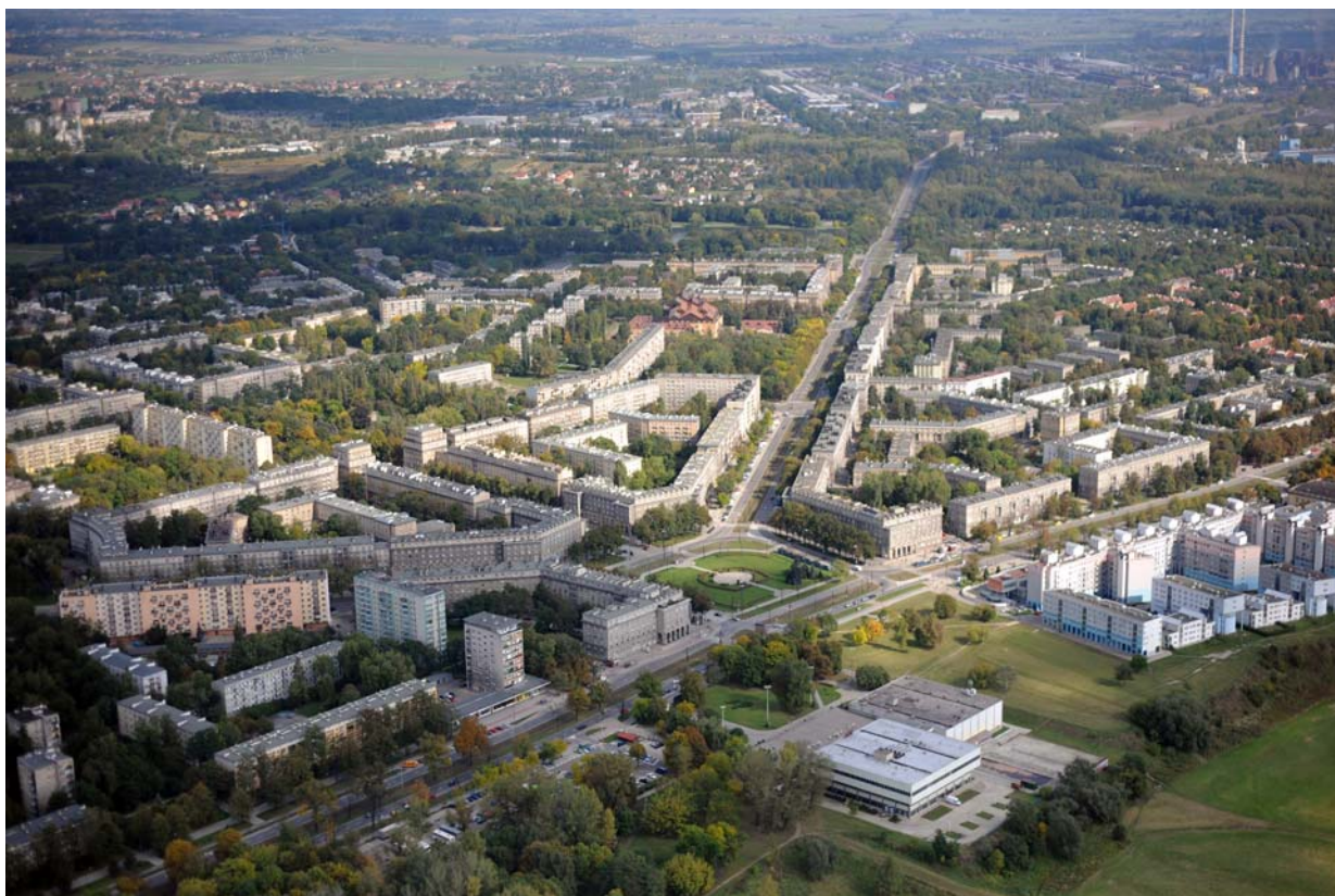
Ryc. 1. Centrum Nowej Huty od południowego zachodu. Fot. Wiesław Majka, 2009