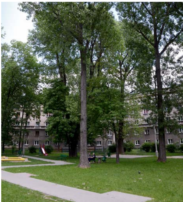
Ryc. 4. Niepielegnowana zieleń Nowej Huty – konflikt z architekturą.

Architektura Nowej Huty lat pięćdziesiątych szczególnie uniknęła większych przekształceń. Jednak proces drobnych modernizacji, mnożonych przez efekt skali, daje zauważalnie negatywne skutki. Znaczące były pod tym względem zwłaszcza lata osiemdziesiąte, gdy służby