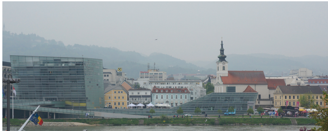
il. 3. Linz – Ars-Electronica Center i Josefskirche Stadtpharre Urfahr / Linz – Ars-Electronica Center and the Josefskirche Stadtpharre Urfahr