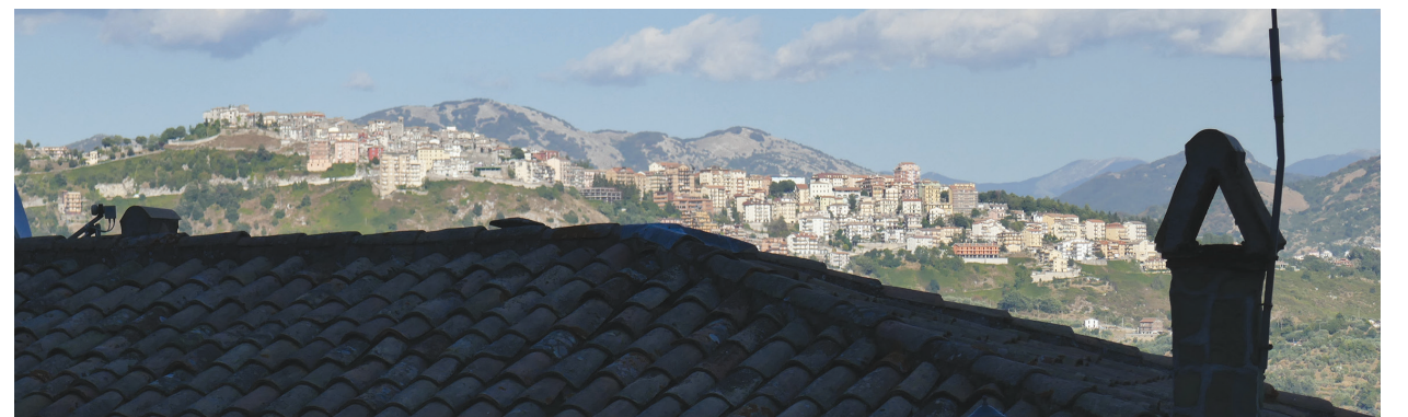
il. 6. San Vito Romano, efekt separacji planów w ekspozycji ze światłem. / San Vito Romano, the effect of the separation of the planes in a frontally lit exposition.