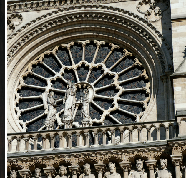
il. 21, 22. Paryż, Notre Dame, witraż, i rozeta w widoku od zewnątrz / Paris, Notre Dame, the stained glass window and the rosette seen from outside

Współczesnym nawiązaniem do idei witrażu jako efektu barwnej, ozdobnej powierzchni uzyskiwanej tylko za pomocą światła może być świetlny mapping (il. 23). Spektakularność jego jest nawet większa dzięki technice umożliwiającej krycie dużych powierzchni (całe elewacje), zmienności w czasie (wyświetlanie kolejnych obrazów), często powiązanych z dźwiękiem. Ta ostatnia cecha zwraca uwagę na istotną różnicę. Jest nią ulotność, wynikająca w większości przypadków z charakteru incydentalnego pokazu. Ze skali i nagromadzenia środków wyrazu wynika zaanektowanie niemal całej uwagi widza, a więc przejęcie roli absolutnej dominanty w percepcji chwilowej. Następnym rozwiązaniem umożliwiającym przez nowoczesną technikę, pokrewnym z mappingiem, choć pozbawionym jego krótkotrwałości, również będącym kontynuacją idei witrażu jest elewacja świetlna 8 . Jej przykładem może być Muzeum Fundacji Louisa Vuittona w Paryżu projektu Franka Gehry'ego. Nie jest to proste oświetlenie wydobywające kształt obiektu z mroku, ale kolorowy obraz o wewnętrznych, patchworkowych, podziałach jak w witrażu. Analogie do niego wzmacnia sposób podświetle-