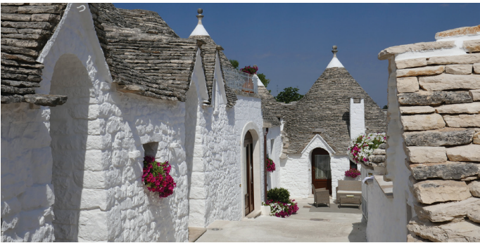
il. 10. Alberobello – ekspozycja faktury przez oświetlenie słoneczne / Alberobello – the sunlight exposing texture

Another problem has been signalled here – that of the influence of light and weather on either the exposition or fading of the grounds in landscape views. On next photograph (ill. 5) we can see the influence