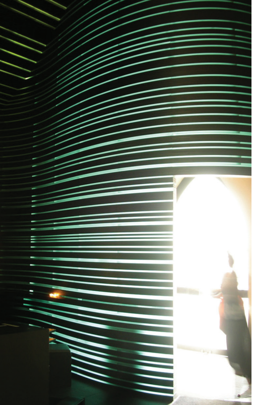
il. 25. Kaplica Santa Klara, Norymberga / The Sankt Klara chapel, Nurnberg

nia od spodu (il. 24). W tym przypadku widok dzienny zbliżony jest w sile oddziaływania do nocnego.