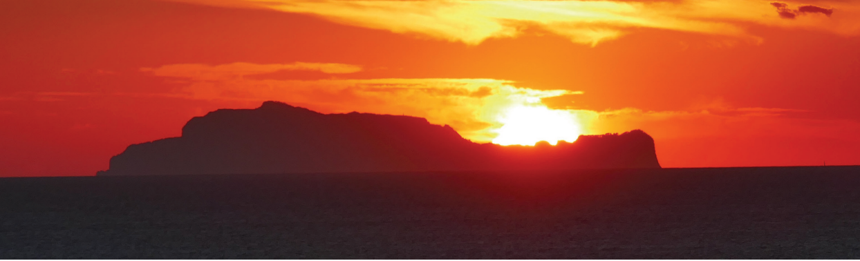
il. 8, 9. Meteory i Asyż – ekspozycja elementów konturu. / The Meteora and Assisi – exposing elements of the contour.