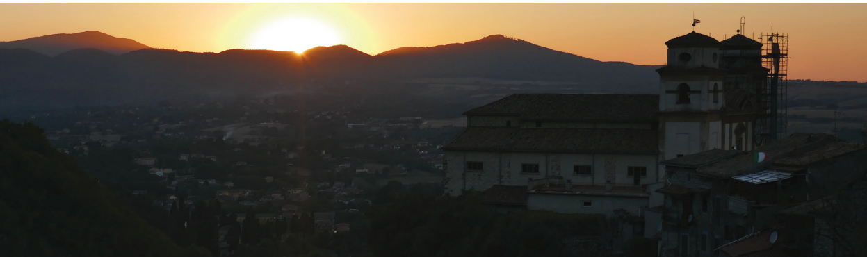
il. 14. Artena, panorama – zmierzch / Artena, a panorama – dusk