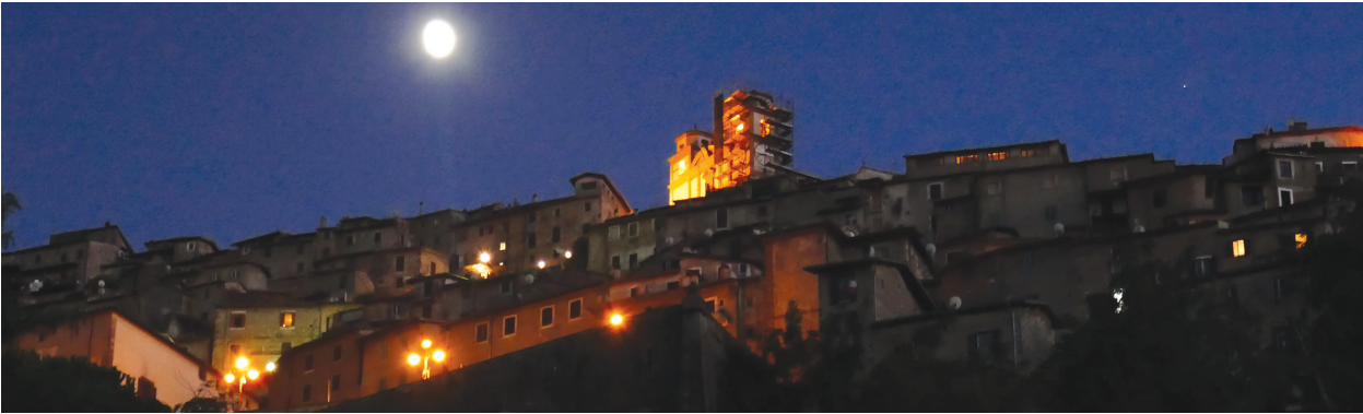
16. Artena, panorama wieczór / Artena, panorama – evening