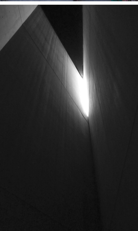
il. 17 i 18. Manarola, uliczka- dzień i wieczór (fot. MP) / Manarola, a street – view during the day and during the evening (phot. MP) il. 19. Piza, oświetlenie dzienne detalu (fot. MP) / Pisa, daylight illuminating an architectural detail (phot. MP) il. 20. Berlin, Muzeum Żydowskie (fot. MP) / Berlin, Jewish Museum (phot. MP)

tego światła z surowością materiału pustych ścian niesie nastrój spójny z intencją przekazu treściowego (fot. 20). W tym przypadku światło stało się samoistnym, głównym elementem kompozycji. Kreacja obiektów dominujących w percepcji przy pomocy światła dotyczy również większych powierzchni. Przykładem mogą być witraże. Odgrywały ogromną rolę we wnętrzach kościołów historycznych. Z zasady ich działania wynikała widoczność od wnętrza w dzień, którego światło ożywiało je powodując iż stawały się przykuwającymi uwagę obrazami. Wieczorem efekt zanikał, a więc kompozycja wnętrza miała zupełnie inny rozkład dominant i akcentów. Z braku efektu ozdobności przeszklenia w widoku od zewnątrz twórcy zdawali sobie sprawę rekompensując go bogactwem rzeźbionego detalu (il. 21,22)