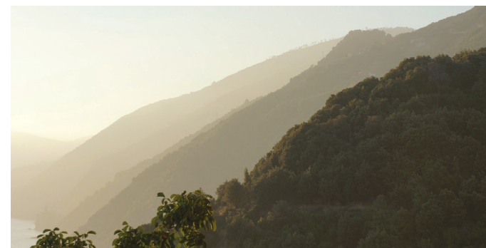
il. 5. Cinque Terre, efekt separacji planów w ekspozycji pod światło / Cinque Terre, the effect of the separation of the planes in a backlit exposition

On the image to the left, the strong light of the sun and the contrasting background of the dark sky intensely expose the bright facade of the church. It becomes the clear focal point of the view (in the case of this frame it is additionally accented by the red umbrella). The fragment of interesting modern architecture that is visible in the frame is barely no-