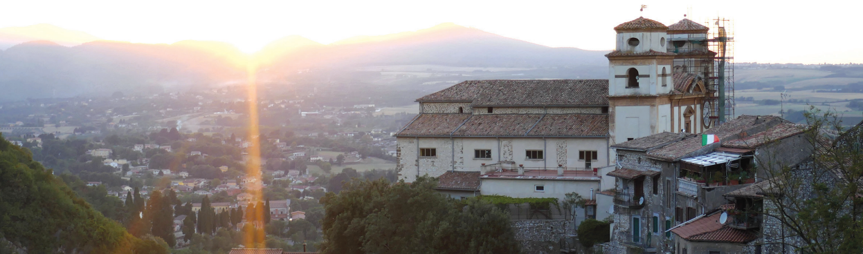
il. 13. Artena, panorama / Artena, a panorama