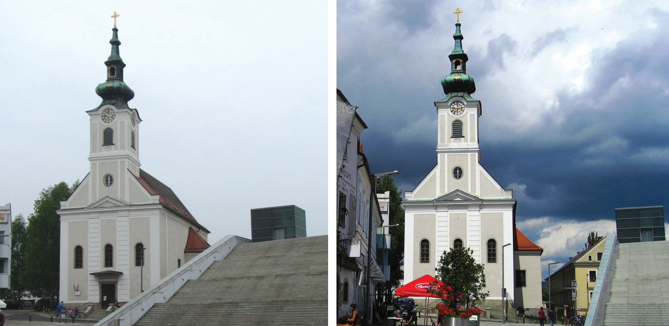
il. 1,2 Linz – Josefskirche Stadtpharre Urfahr i fragment Ars-Electronica Center / Linz – Josefskirche Stadtpharre Urfahr and a fragment of the Ars-Electronica Center