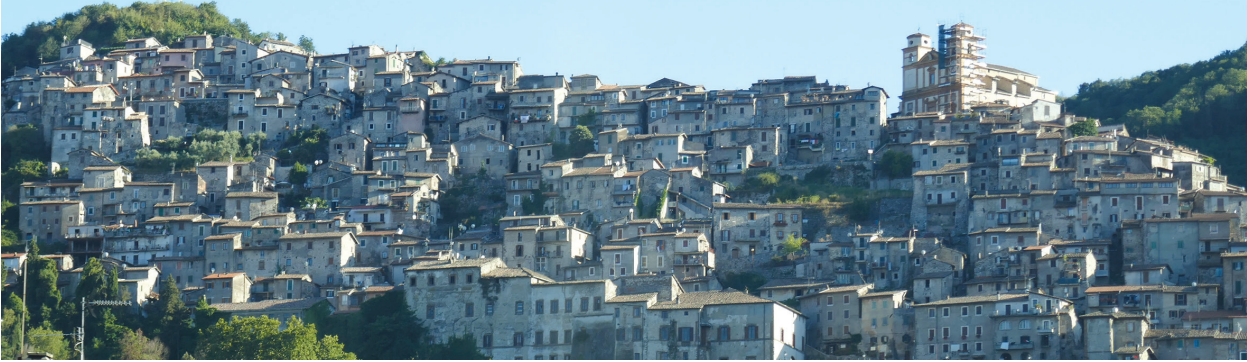
il. 15 panorama – dzień / panorama – daytime