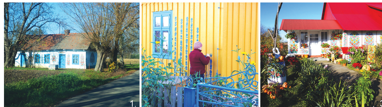
Il. 1, 2, 3. Zalipie, fot. Małgorzata Petelenz, 2017 r. / Zalipie, phot. by Małgorzata Petelenz, 2017

Wall paintings ( malatura in Polish) are a part of architectural ornamentation that has been known for