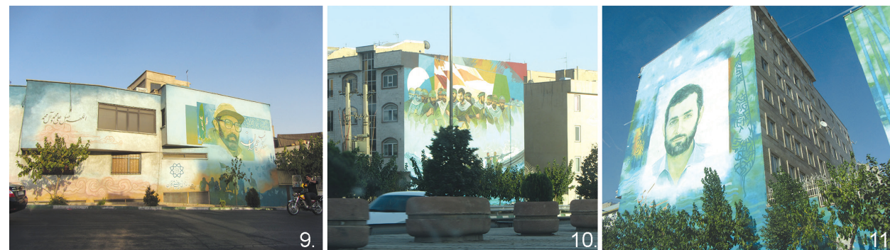
Il. 9, 10, 11. Teheran, fot. Małgorzata Petelenz, 2018 r. / Teheran, phot. by Małgorzata Petelenz, 2018

bardziej politycznych murali w Europie, są już wpisane w kulturę popularną tak powszechnie, że dotyczące ich hasło stanowi niezależną stronę na portalu anglojęzycznej Wikipedii 13 .