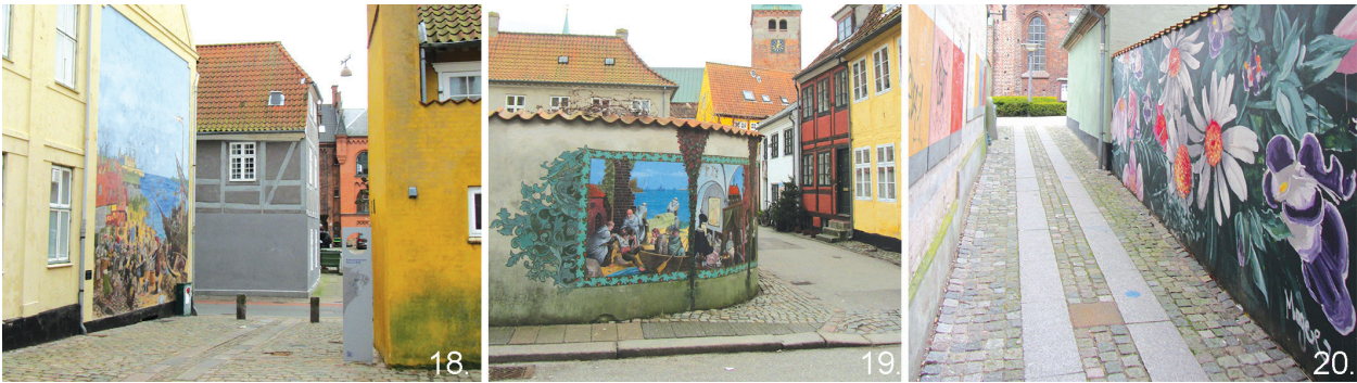
Il. 18, 19, 20. Helsingør, / Helsingør