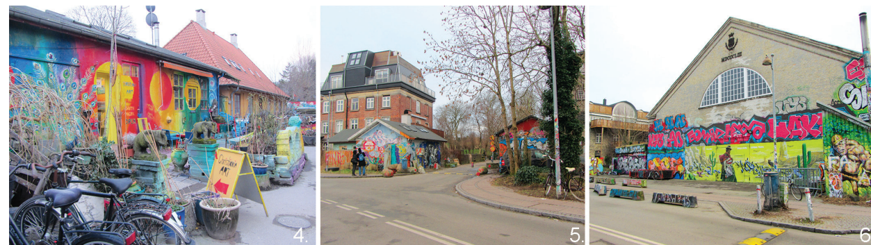
Il. 4, 5, 6. Christiania, Kopenhaga, fot. Małgorzata Petelenz, 2018 r. / Christiania, Copenhagen, phot. by Małgorzata Petelenz, 2018

When strolling along city streets, we most often encounter graffiti of low artistic value, however, Banksy’s character has shown that, as a form of street art, it is as diverse as any other field of human activity. How-