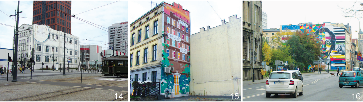
Il. 14, 15, 16. Łódź, fot. Małgorzata Petelenz, 2017 r. / Łódź, phot. by Małgorzata Petelenz, 2017