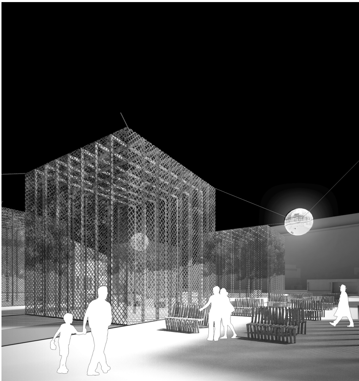
II. 2. Wizualizacja fragmentu przestrzeni Placu Centralnego (rys. K. Dudzic-Gyurkovich)