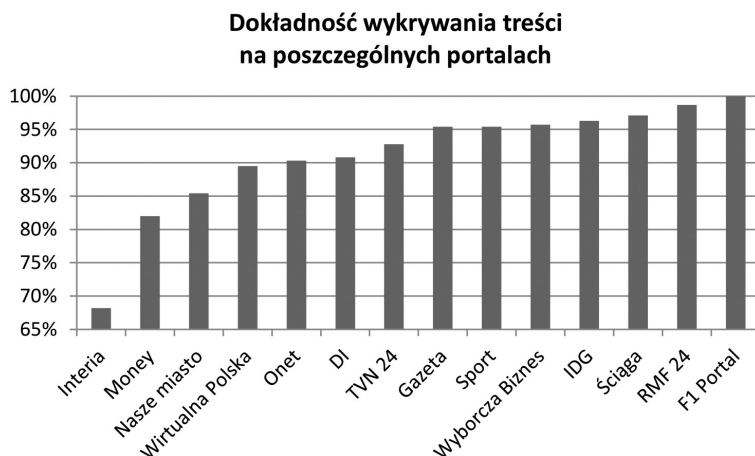
Rys. 1. Dokładność wykrywania treści dla poszczególnych portali (opracowanie własne)

Dokonano również obserwacji, z której wynika, że znaczna większość błędów rozpoznawania powiela się w obrębie danego portalu. Stąd też bardzo słaby wynik działania algorytmu dla portalu Interia, gdzie głównym problemem były działy, w których podpisów pod zdjęciami nie wydzielono osobnym blokiem, a na końcu artykułów przez pewien okres czasu znajdował się tekstowy materiał reklamowy, również niewydzielony do osobnego bloku.