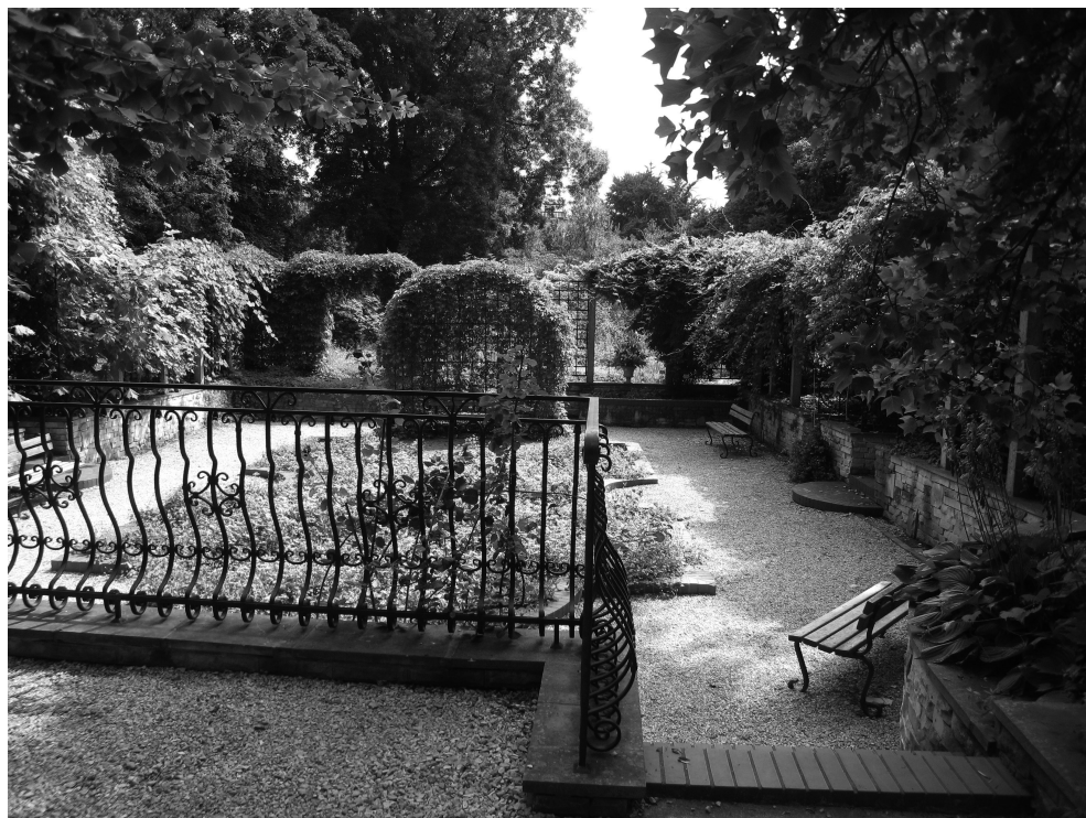
Il. 3. Dział roślin pnących (fot. Joanna Dudek-Klimiuk, lipiec 2010)

Części ogrodu o charakterze rodzajowym, jak różanka, alpinarium czy dział pnączy, urządzono zgodnie z zasadami charakterystycznymi dla modernizmu jako przestrzeń ujętą w silne ramy geometrycznych form, kontrastującą z miękkością i bogactwem faktur roślin (il. 3).