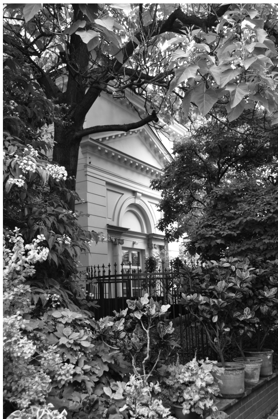
Il. 4. Fragment Trebhauzu (część środkowa – Salon) (fot. Joanna Dudek-Klimiuk, wrzesień 2010)

Niecodzienność kompozycji roślinnych, ich bogactwo i wyjątkowość sprawia, że przechodząc przez bramy ogrodu botanicznego, przenosimy się w wyobraźni w miejsca odległe, czasem przez nas niepoznane. To, czego często obawiamy się w innych kompozycjach ogrodowych, tj. nadmiernego nagromadzenia różnych roślin, zestawienia kontrastujących ze sobą barw i faktur, tu zyskuje naszą aprobatę, nie budząc sprzeciwu. Zapewne dzięki duchowi miejsca i zaskakującej ciszy (pomimo bliskości miasta) odpoczywamy i, z łatwością zapominając o realnym świecie, podziwiamy piękno natury (il. 4).