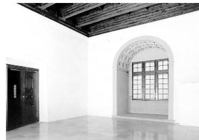
Skrzydło zachodnie Zamku Królewskiego na Wawelu, Sala z wykuszem – stan przed i po konserwacji