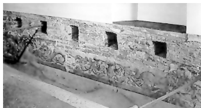
Skrzydło zachodnie Zamku Królewskiego na Wawelu, sień nad bramą – odkryty renesansowy fryz podstropowy oraz gniazda belek – stan przed konserwacją